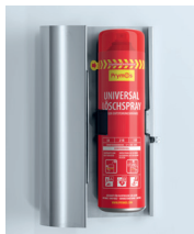
Design-Mantel inkl. Wandhalterung (ohne Dose):