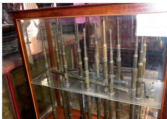
Die mit Salz gefüllten Blasrohre in einem buddhistischen Tempel in Penang/Malaysia dienen zur Brandbekämpfung. Durch kräftiges Hineinblasen wurde das Salz in das Feuer geschleudert. Waren das die ersten Pulverlöscher?

Und schließlich erfolgt unmittelbar nach der Montage die Einweisung der Mitarbeiter in den Gebrauch der